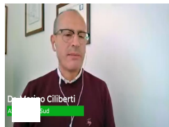
Trattamento lesioni croniche con ossigenoterapia topica