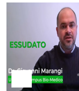
Vantaggi della medicazioni a di fibre gelific nuova genera