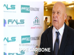
Carbone: Vogliamo riconoscimento reale per i professionisti sanitari